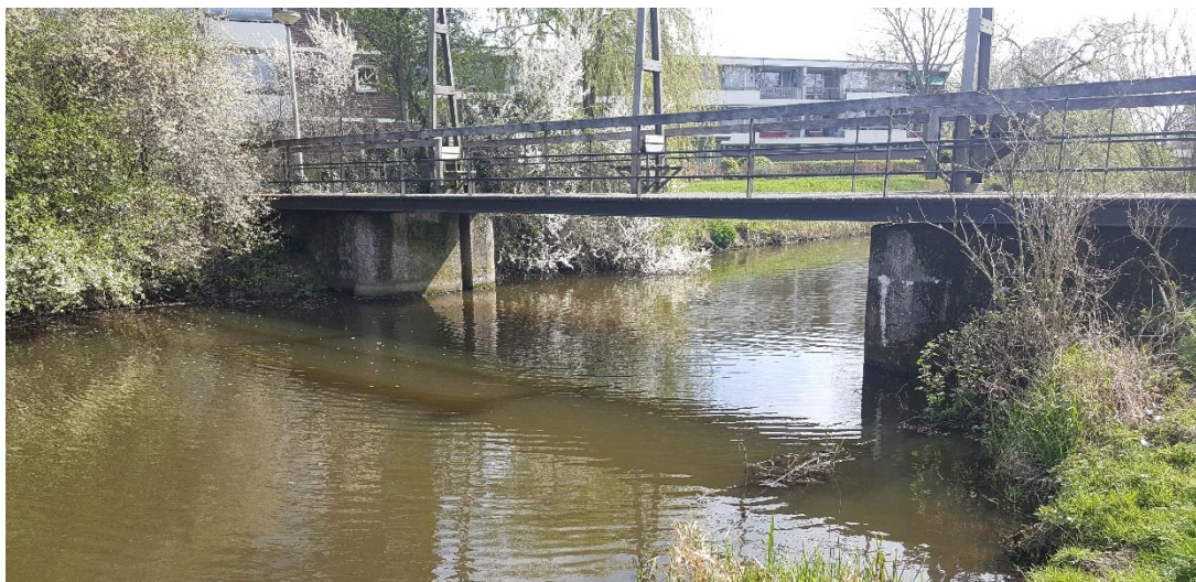
Figuur 2: Foto locatie tijdens veldbezoek op 9 april 2019.