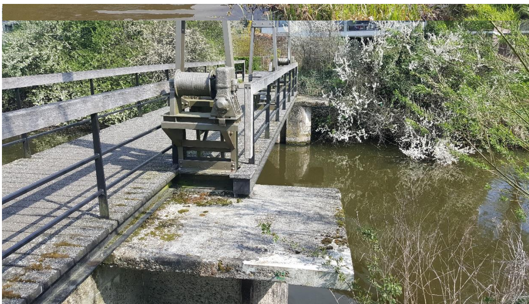
Figuur 3: Foto locatie tijdens veldbezoek op 9 april 2019.